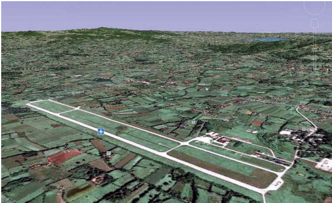
Satelitski snimak aerodroma u Lađevcima

Vojna vazдушna luka kod Kraljeva sve bliže civilima i privredi. Preuređenje "Lađevaca" u "Moravu" koštaće 2,5 milijarde dinara