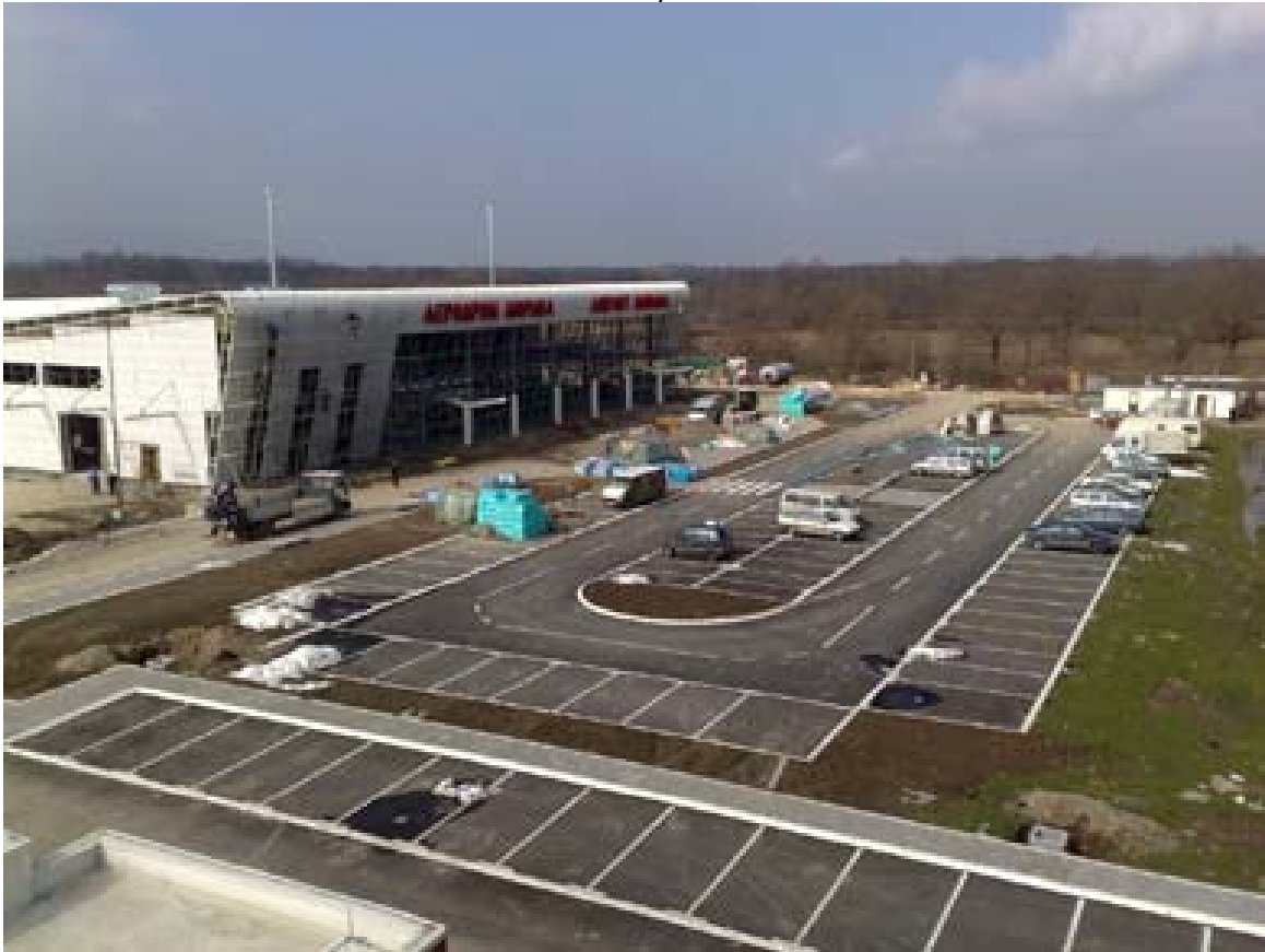
Aerodrom MORAVA Slike početkom marta 2012.